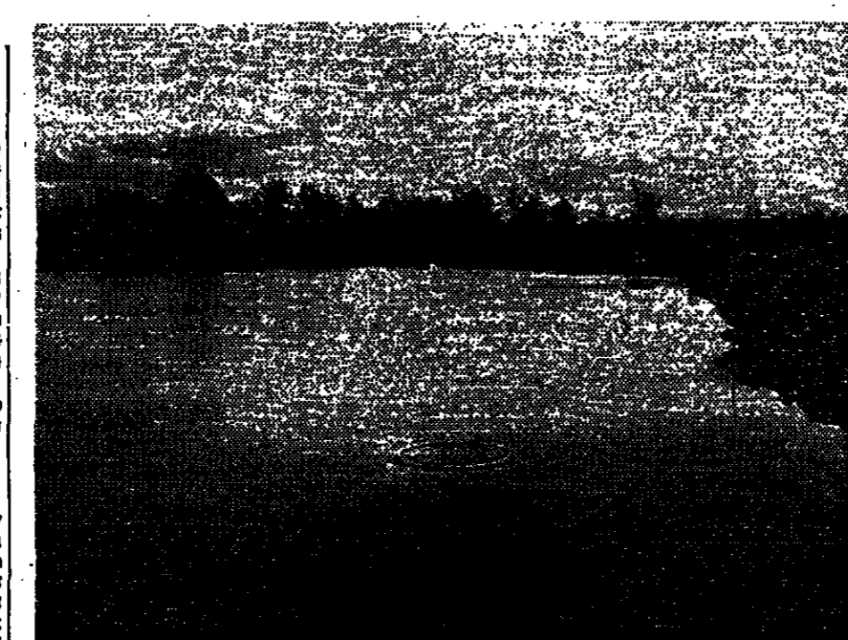
דיונים בעקבות כנס, ליד המצור היפונית.